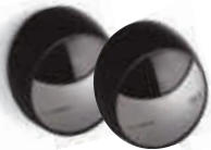
MOFB fotokomórki (para) BLUEBUS zasięg 15-30 m