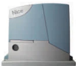
ROBUS350 silownik z wbudowaną centralą sterującą BLUEBUS