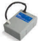
PS124 akumulator 24V 1.2 Ah z wbudowaną kartą ładowania