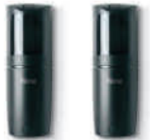
F210B fotokomórki (para) BLUEBUS, nastawne z kątem 210°, zasięg 15 m