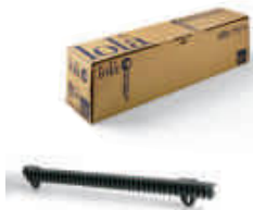
LOLA listwa zębata nylonowa M4, w odcinkach po 0,5 metra, pakowana po 10 sztuk, cena za 5 mb